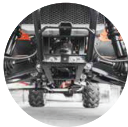
Suspensão independente McPherson